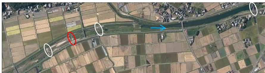
堰周辺状況(航空写真)